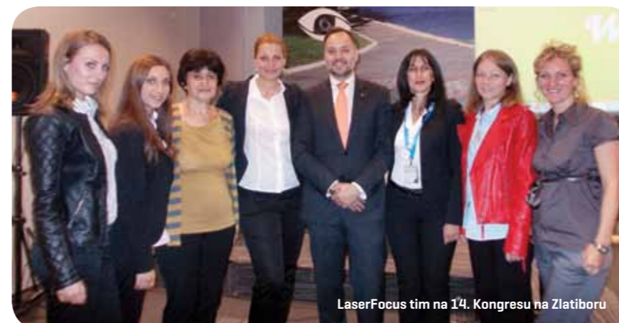
LaserFocus tim na 14. Kongresu na Zlatiboru